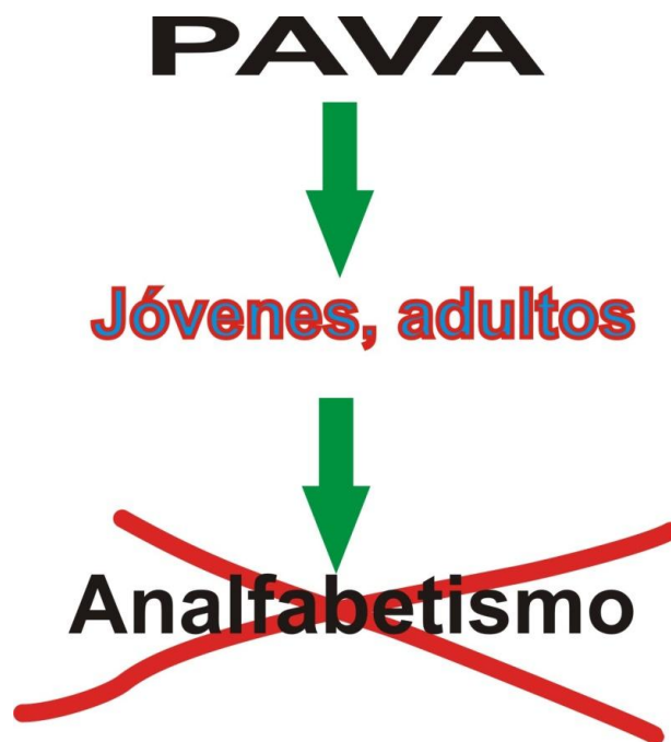
Gráfica 1. El PAVA es una apuesta a impactar y derrotar el analfabetismo en jóvenes y adultos en Colombia.

La flexibilidad del programa justamente se cimenta sobre una propuesta andragógica y en una diversidad de medios, herramientas y utilidades tecnológicas que apoyan el proceso de aprendizaje entre los adultos que se alfabetizan y los facilitadores alfabetizadores que los orientan. La concepción andragógica iluminó la propuesta por cuanto dejó claro que el joven adulto aprende teniendo como marco el cúmulo de experiencias vividas, lo cual es un valioso insumo que habría de tenerse en cuenta en lo metodológico, en el diseño de actividades y estrategias de aprendizajes.